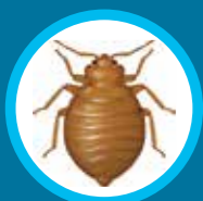
Punaises de lit