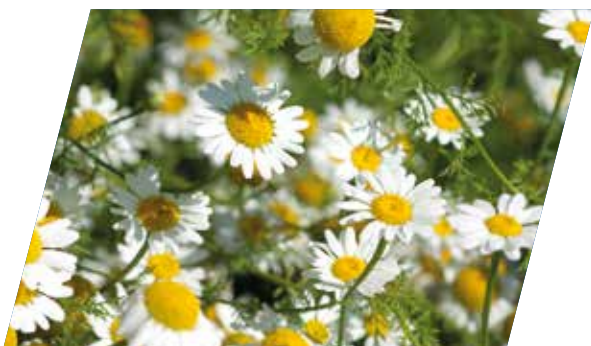
Fleurs de Pyrethrum cinerariaefolium

AquaPy® contient 3 % de pyréthrinés naturelles, issues d'extrait de fleurs.