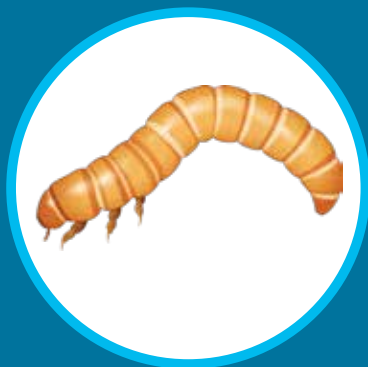
Larve de ténébrion