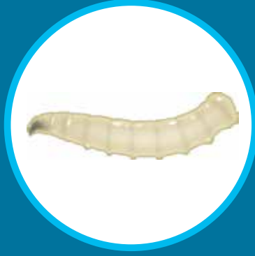
Larve de mouche