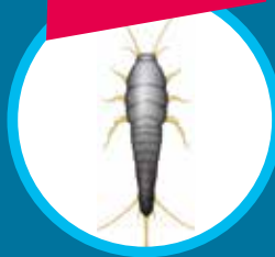
Poissons d'argent gris